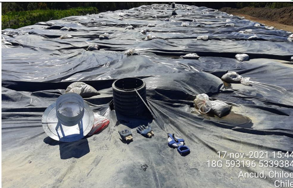
Fotografía N°17: Medición de Niveles de cámaras por Personal Municipal. Tomada: 17 de Noviembre del 2021del 2021.