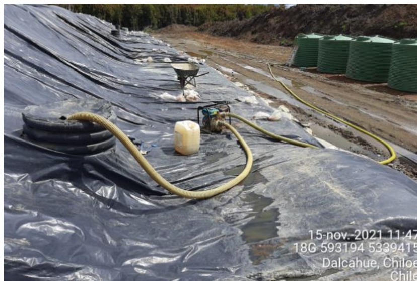
Fotografía N°1: Retiro de Lixiviados desde cámaras sobrecelda por Personal Municipal. Tomada: Lunes 15 de Noviembre del 2021.

Para dar cumplimiento a lo indicado en Res. Exenta N°2291, emitida con fecha 18 de Octubre del 2021. A continuación, se presenta el registro fotográfico de las actividades de extracción de la semana del 15 al 21 de Noviembre del 2021.