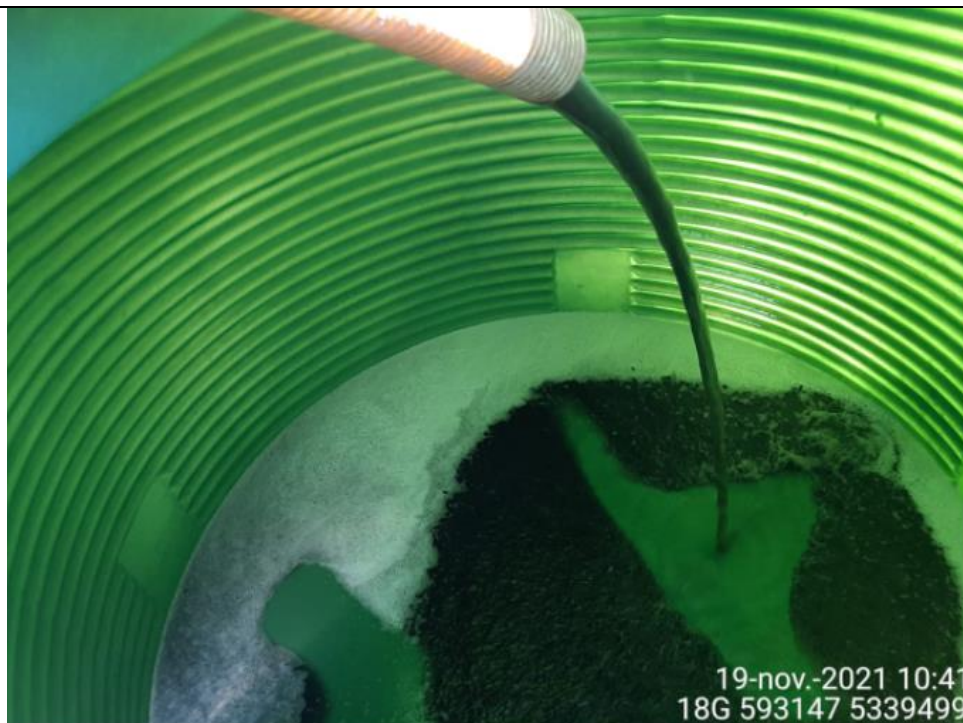
Fotografía N°10: Retiro de Lixiviados a estanque de acumulación. Tomada: Viernes 19 de Noviembre del 2021.