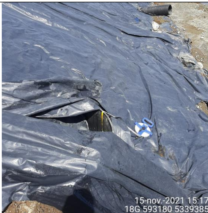
Fotografía N°15: Medición de Niveles de cámaras por Personal Municipal. Tomada: 15 de Noviembre del 2021.