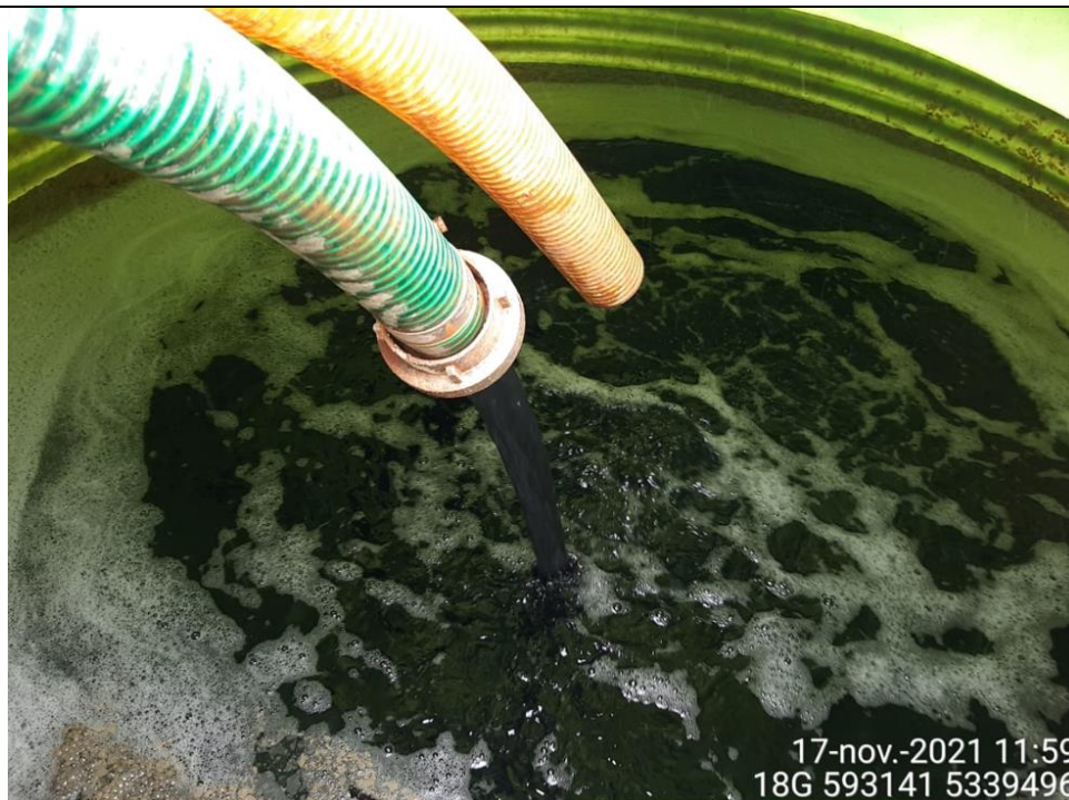
Fotografía N°6: Extracción de Lixiviados a estanque almacenamiento. Tomada: Miércoles 17 de Noviembre del 2021.