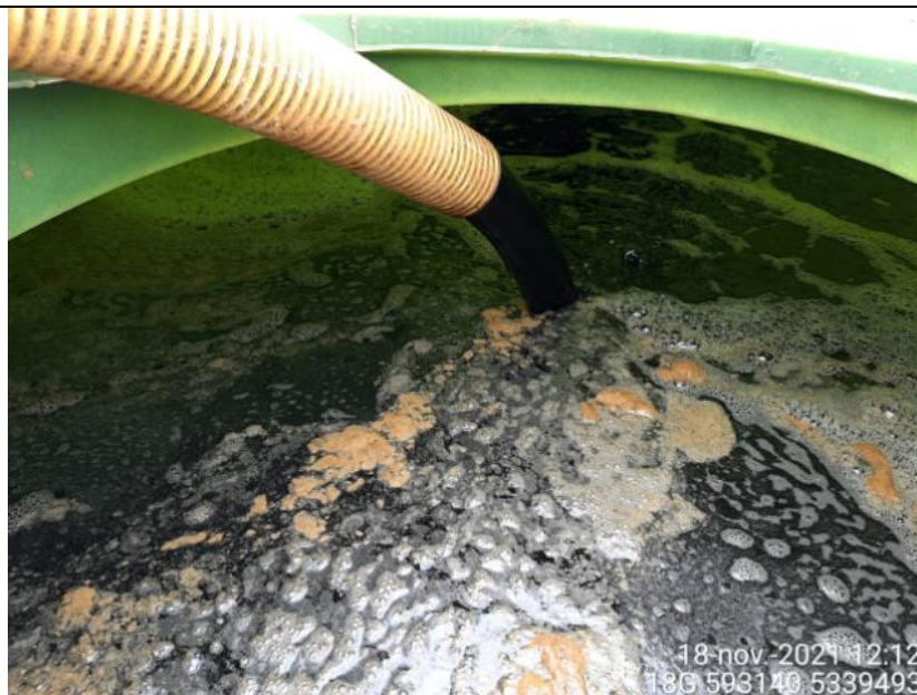
Fotografía N°8: Extracción de Lixiviados a estanque. Tomada: Jueves 18 de Noviembre del 2021.