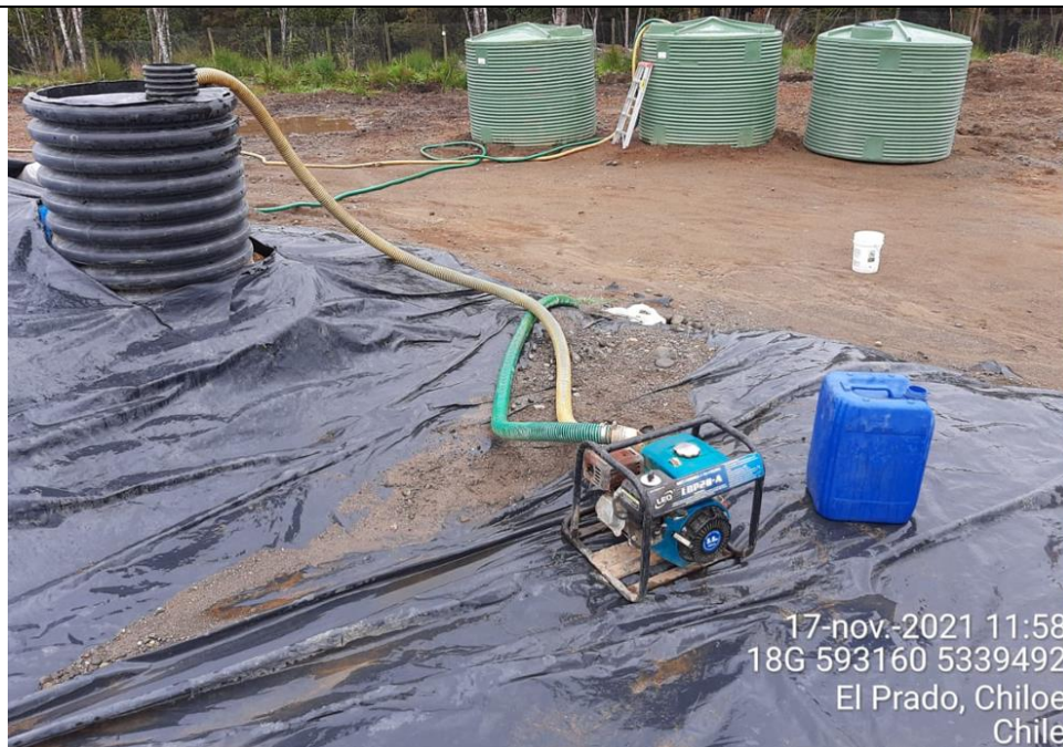
Fotografía N°5: Extracción de Lixiviados desde Cámara C10. Tomada: Miércoles 17 de Noviembre del 2021.