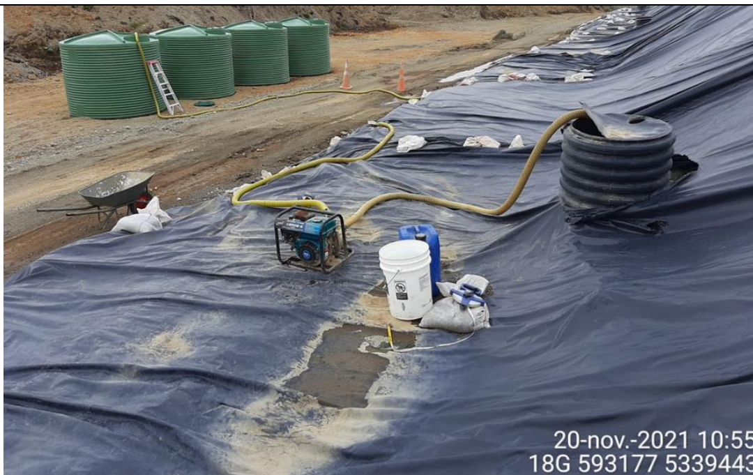
Fotografía N°11: Extracción de Lixiviados desde cámara C12. Tomada: Sábado 20 de Noviembre del 2021.