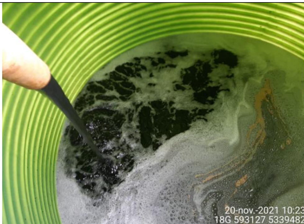
Fotografía N°12: Retiro de Lixiviados a estanque de acumulación. Tomada: Sábado 20 de Noviembre del 2021.