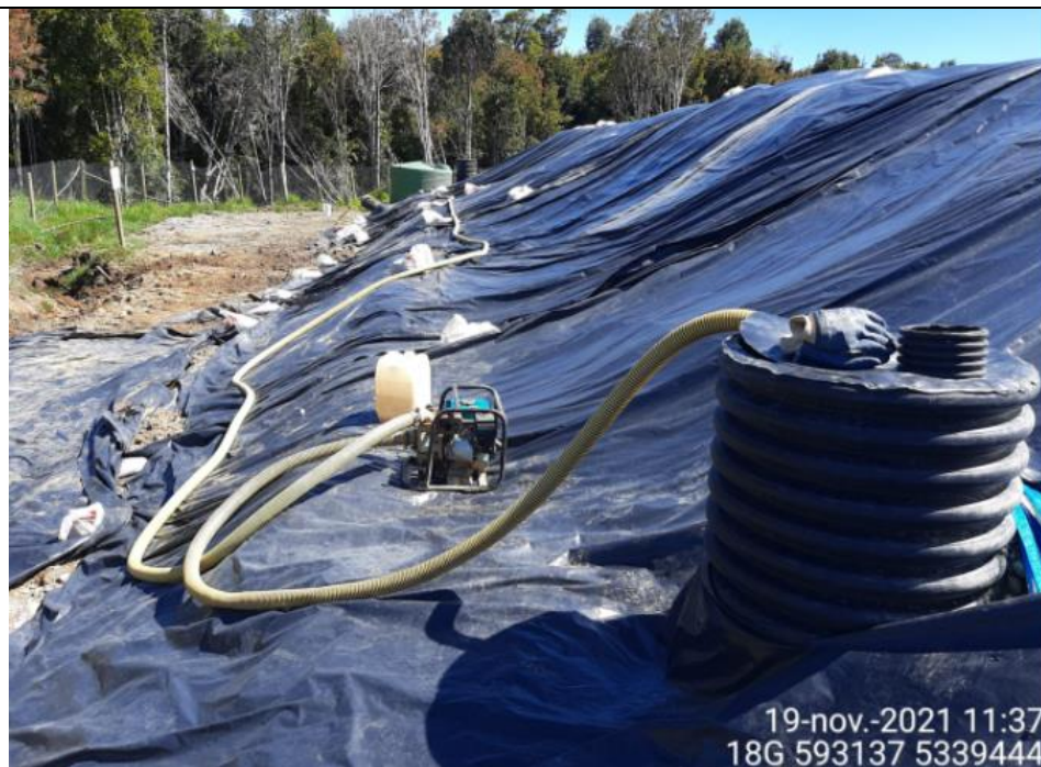
Fotografía N°9: Extracción de Lixiviados en cámara C07. Tomada: Viernes 19 de Noviembre del 2021.