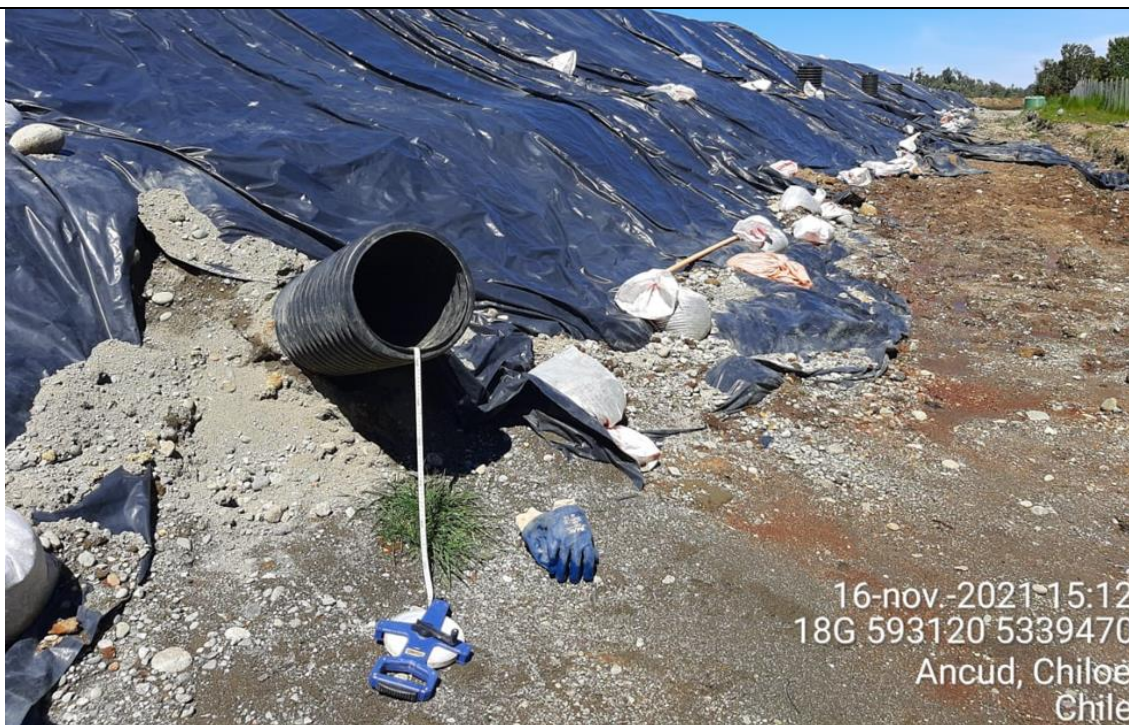
Fotografía N°16: Medición de Niveles de cámaras por Personal Municipal. Tomada: 16 de Noviembre del 2021.