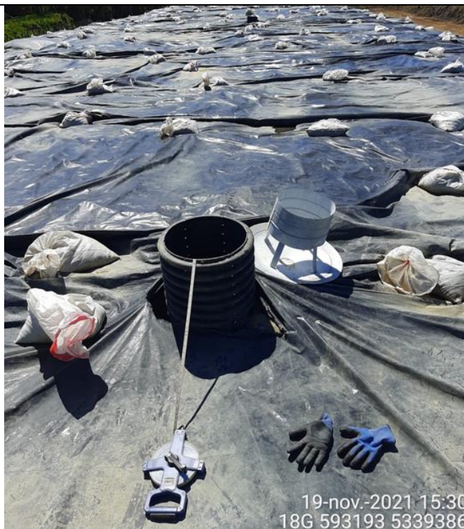
Fotografía N°19: Medición de Niveles de cámaras por Personal Municipal. Tomada: 19 de Noviembre del 2021.