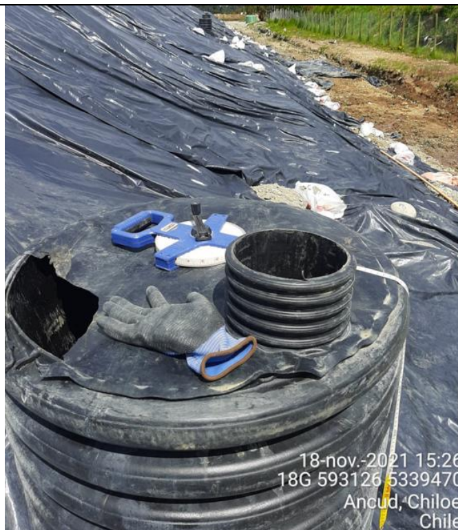
Fotografía N°18: Medición de Niveles de cámaras por Personal Municipal. Tomada: 18 de Noviembre del 2021.