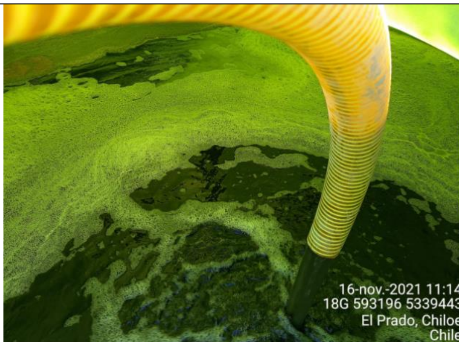
Fotografía N°4: Retiro de Lixiviados a estanque por Personal Municipal. Tomada: Martes 16 de Noviembre del 2021.