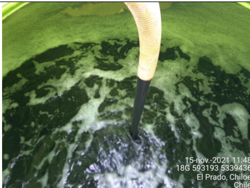
Fotografía N°2: Retiro de Lixiviados a estanque de acumulación por Personal Municipal. Tomada: Lunes 15 de Noviembre del 2021