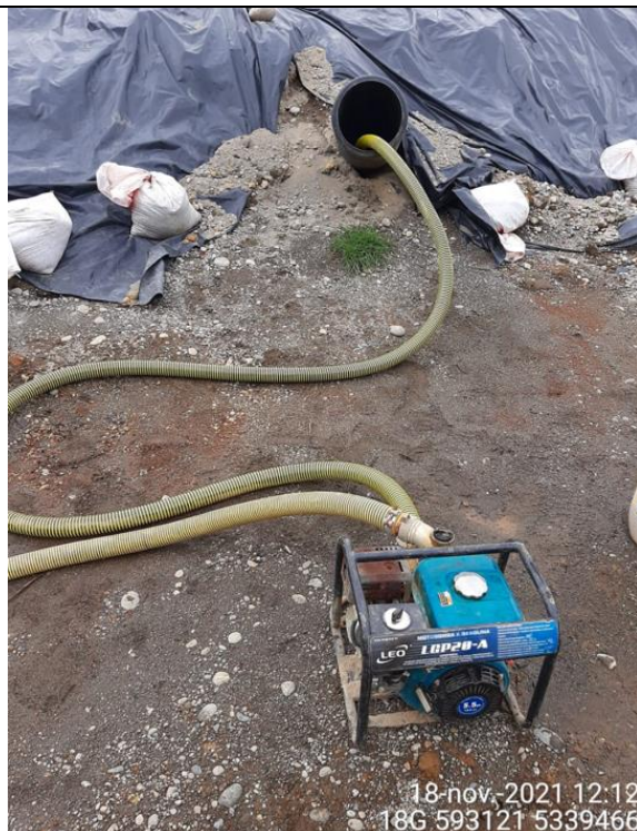
Fotografía N°7: Extracción de Lixiviados desde diagonal D04 por personal Municipal Tomada: Jueves 18 de Noviembre del 2021.