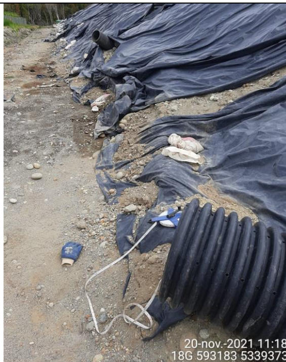
Fotografía N°20: Medición de Niveles de cámaras por Personal Municipal. Tomada: 20 de Noviembre del 2021