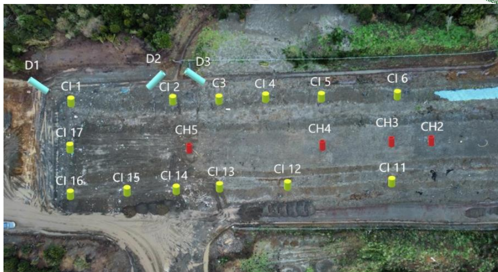
Fotografía N°14: Adecuación Zanja Sanitaria N°1- Parte Sur. Imagen Aérea I. Municipalidad de Ancud.

Se adjunta imagen donde se encuentra personal de Municipal realizando mediciones de cámaras de monitoreo de sobrecelda. Se realiza misma técnica de medición de cámaras realizada en terreno por la SMA al momento de inspeccionar el recinto sanitario.